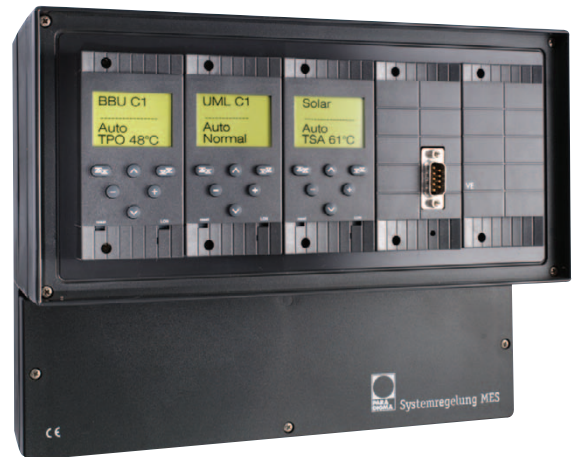
Regelmodule im Wandgehäuse

Welche Systemregelung MES – sie wird übrigens im Wandgehäuse geliefert – den Anforderungen Ihrer Heizanlage entspricht, sagt Ihnen Ihr Paradigma Fachhandwerks-Betrieb. Natürlich übernimmt er auch Installation und Wartung Ihrer Paradigma Systemregelung MES.